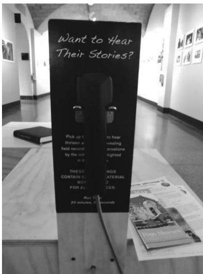
図1 展示スペース中央に設置された受話器

同じように、訪問者に問いかけ、議論する場が設けられていたのが、ペンシルヴェニア大学附属考古学博物館（Penn Museum）で行われていた「本物の麻薬常用者達（rigteous dopefiend）」という小さな写真展示である 5) 。アメリカ都市部のホームレスの人達、特に麻薬中毒者をテーマとするこの展示では、ホームレスの人達の日々の暮らしを、恋愛観や親との関係、仕事、過去と未来、国に対する思いなど様々な観点から映し出す写真とパネルが展示されている。この写真パネルの展示だけであれば特段取り上げるようなものでもないが、この細長い展示スペースの中央には、受話器がおかれ、その受話器を取ると、ホームレスの人達の暮らしを彼ら自身の言葉で聞くことができるようになっている（図1）。もちろんこの電話はオンラインではないが、貧困と麻薬中毒という「人間の苦痛」の中にいるものとして一方的に表象され、展示されるだけで物言わない存在ではなく、展示される側も声を出し、主張し、訪問者に語りかける、そういった工夫が施されていた。また麻薬常用者達を援助する団体の紹介リーフレットや、寄付箱も設置され、展示を鑑賞した訪問者が次の