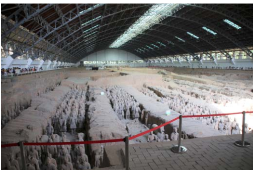
写真3 兵馬俑坑1号坑

殷墟博物館は、殷墟の解説と出土した遺物の保存・展示を目的とした博物館である。展示は、青銅器、玉製品、甲骨文字の順に構成され、常時600点余りの資料が展示されている。殷墟の敷地内には、車馬坑や甲骨の大量埋納坑の出土状態の展示や、墓地埋納状態にガラス天井を設けた密閉式覆屋など、数多くの野外展示がなされている(写真5)。現地ガイドによると、野外展示資料は複製資料(二次資料)であり、遺跡に臨場感を与えるために展示しているとのこ