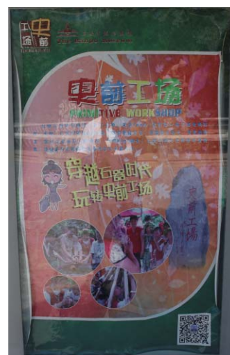
写真4 西安半坡博物館教育普及ポスター