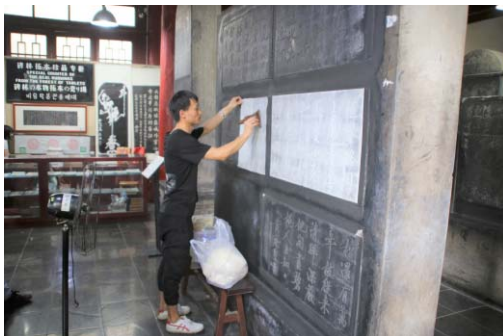
写真11 西安碑林博物館の採拓風景

当該地域のミュージアムショップは、総じて本来の目的である「博物館の展示や教育活動の延長として教育効果を高める」ことが意図されている傾向にある。加えて、松永久が述べた「ミュージアムショップ充実の度合いは来館者の最終的な満足度を決める重要な要素である」といった考えに対し(松永 [2005: 50-54])、当該地域の店舗では十分に満足し得るグッズ展開がなされていたことが特徴である。昨年度調査した甘粛省下の博物館の中では、甘粛省博物館以外に明確なミュージアムショップが設けられていない状況を明らかにしたが(落合・中島 [2019: 99-110])、本年度調査では店舗を設けている殆どの館がオリジナリティに富んだショップとして運営されていた。これは、①当該地域には中国政府が指定する国家一級博物館が多々存在し 20) 、あらゆる面で他の博物館を牽引する立場であることから、グッズ等にも力を入れていること、②西安や安陽(殷墟)は全世界的に著名な観光地であり、また石家荘市も北京・天津から近く世界遺産も複数擁する地域であることから、当該地域を訪れる人々への土産の意義を有することが、その要因として考えられる。