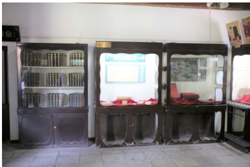
写真2 青龍寺陳列室の展示

青龍寺のほぼ中央に位置する青龍寺遺址博物館は、青龍寺跡から出土した遺物と日中文化交流に関する歴史・美術資料を展示する博物館で、2012年5月に開館した 9) 。3階建ての館内は、1階に唐時代の青龍寺の出土資料、2階に空海に関する歴史、3階に空海の時代である隋・唐時代の文物の展示をそれぞれ設けている。また2階の展示では、空海を通じた日本の紹介として、真言宗系の大学である種智院大学の紹介や、空海が中国から持ち帰ったのが起源とされる讃岐うどんの展示など、奇をてらった展示がなさ