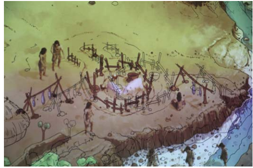
写真9 陝西歴史博物館の映像展示 (下の図と映像がずれている)

一方、今回訪問した民営博物館では、二次元コードを除く情報メディア機器や映像展示を採用している館は見受けられなかった。これは、①民営博物館は設立者の興味および審美眼に基づいて収集された各分野の優品を展示するもので、資料を用いた教育を目的とした展示でないこと、②情報メディア機器や映像展示は導入のために高額な費用がかかるうえに、常に使用さ