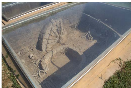
写真5 殷墟博物館の野外展示

とであった。また、オリジナルにあたる一次資料は保存環境の整った博物館で収蔵しており、資料保存と観覧者へのPRを両立させていることが特徴的である。