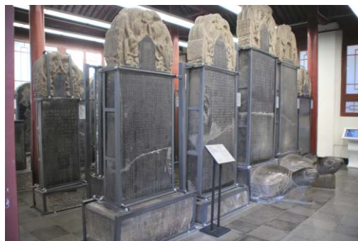
写真6 西安碑林博物館

西安碑林博物館は、西安城壁に隣接して1993年に設置された、石碑を中心とした美術館である(写真6)。西安碑林の始まりは北宋元祐2(1087)年に遡り、1772年時点で石碑の収集、保存、展示といった博物館としての機能を備えていたことから、中国の博物館の嚆矢であると考える研究者も存在する(張[2018:103-134])。現在では、7ヶ所の展示室、8ヶ所の碑亭、6ヶ所の墓誌廊、石刻芸術室などから構成され、4千点余りの資料を収蔵している 16) 。また西安碑林博物館が所在する地域は、「碑林博物館保全地区」として西安市が指定する町並み保存地域となっている(曹[2007:36-51])。