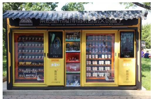
写真12 自販機型ミュージアムショップ (秦始皇帝兵馬俑博物館)