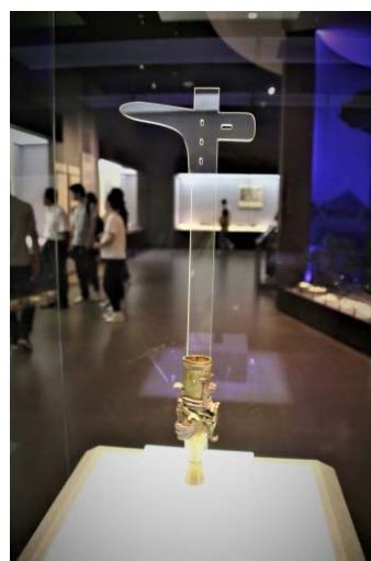
写真8 河北博物院の説示型展示

後者は、陝西歴史博物館や昨年度調査した甘肅省博物館と同様の省立クラスの博物館であり、国家一級文物（日本における国宝クラス文化財）340点をはじめとする優秀なコレクションを収蔵している。同館は、資料の魅力に依拠した展示を実践できる環境にあるにもかかわらず、上記のような展示の工夫を試みている理由としては、西安半坡博物館と同様に博物館展示に教育的意図を持たせているためと推測できる。先述の通り、河北博物院では数多くの教育普及活動を実施し、博物館教育に力を入れていることが伺える。中国では、近年博物館教育が盛んな傾向にあり、上海科技館などの科学博物館を中心に積極的な教育普及活動が実践されているほか、