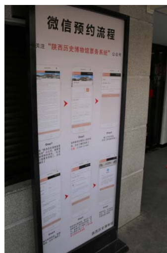
写真1 陝西歴史博物館の入館システム

一方、同館の特徴は入館システムである。同館は、無料館として運営されているが、入館するためにはスマートフォンを使用して入館受付をする必要がある(写真1)。まず、入口で二次元コードを読み取り、身分証やパスポートの