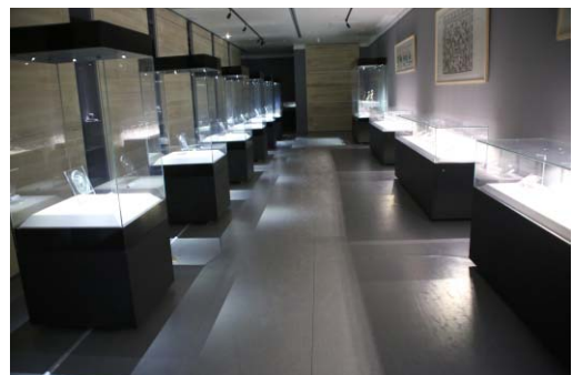
写真7 河北省金文淵青銅芸術博物館

今回調査した3館は、それぞれの博物館が特定のテーマに基づいたテーマ館であり、設立者の興味および審美眼に基づいて収集された各分野の優品が展示されているのが、一貫した特徴である。また、小規模な民営博物館が一つの建物に入居するという構造は、日本では見られない中国独特の博物館運営形態であるといえよう。